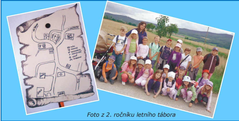
Foto z 2. ročníku letního tábora